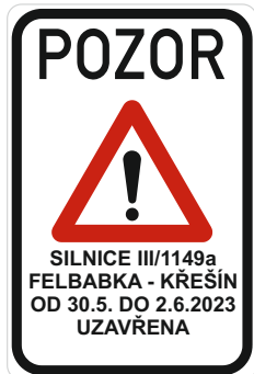
Schéma dopravního značení: přechodná úprava SDZ, úplná uzavírka silnice III/1149a z obce Felbabka do obce Křešín z důvodu opravy povrchu komunikace